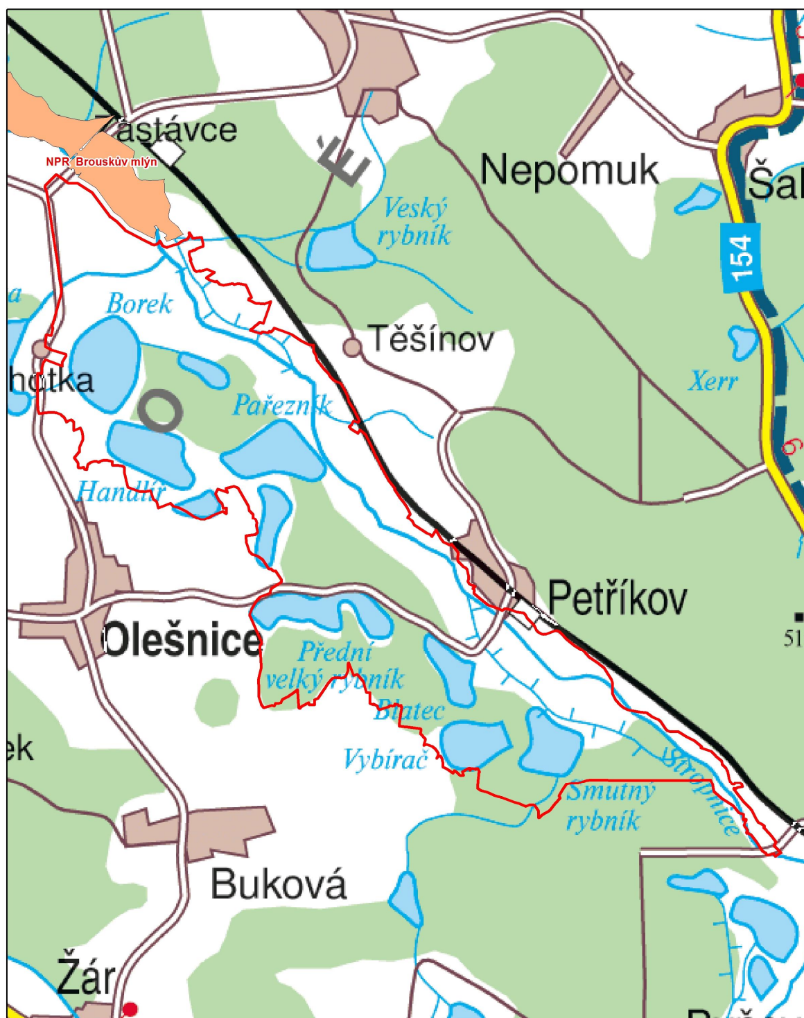
příloha 1: Orientační zákres hranic