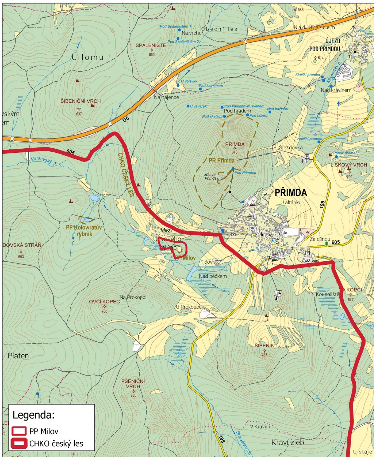
Příloha č. 1: Orientační mapa se zákresem navrhované PP Milov