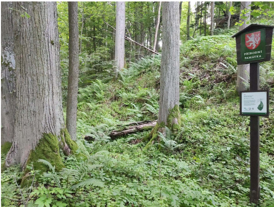
Označení přírodní památky na jižní části pod haldou lomu – 11. 6. 2024