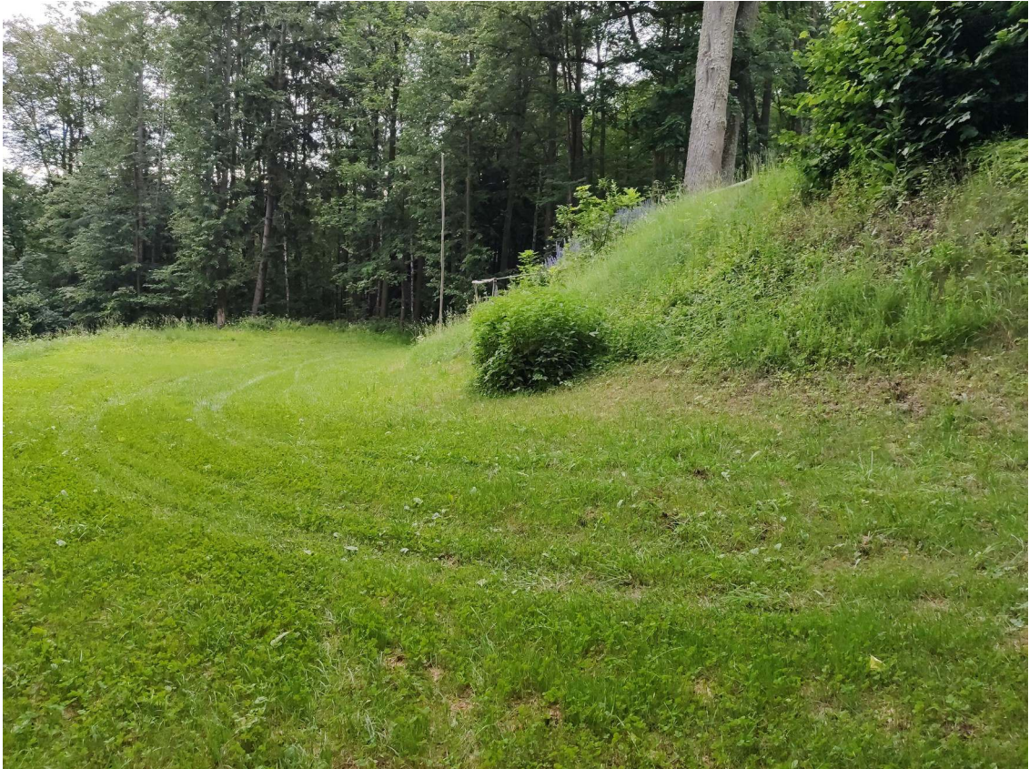
Příjezdová cesta pod chatou – 11. 6. 2024