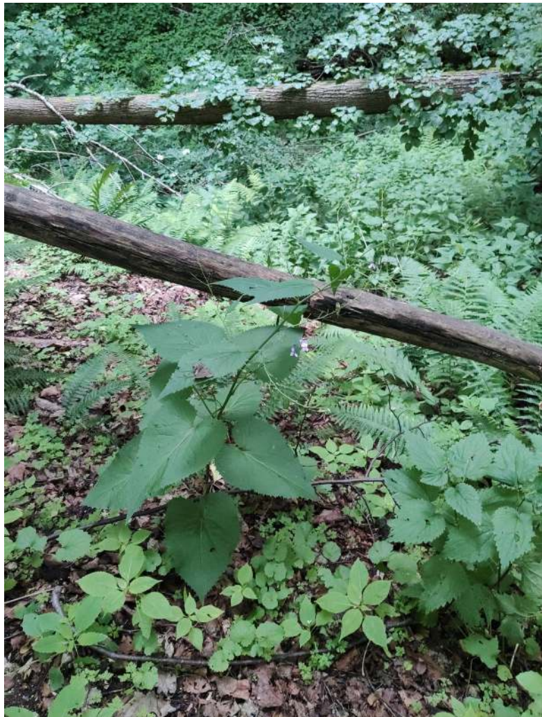
Měsíčnice vytrvalá ( Lunaria rediviva) v lomové jámě – 11. 6. 2024