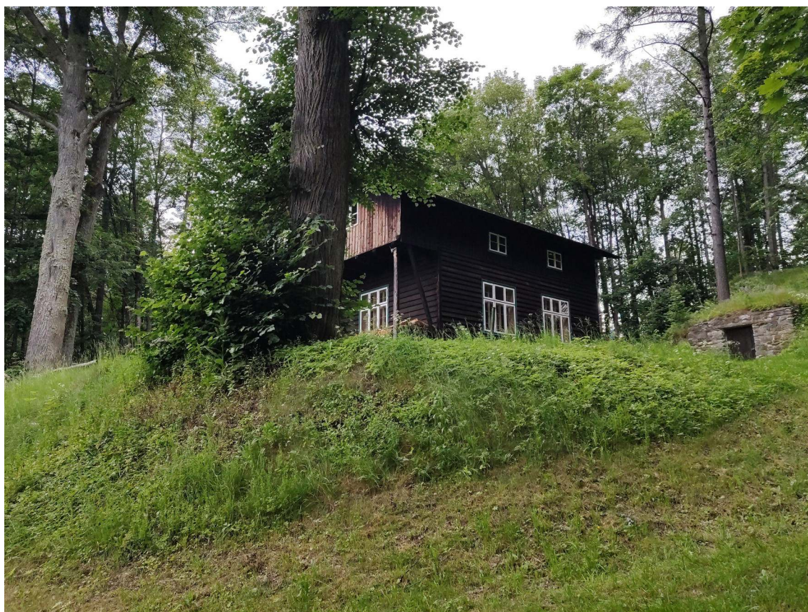
Chata v ochranném pásmu - 11. 6. 2024