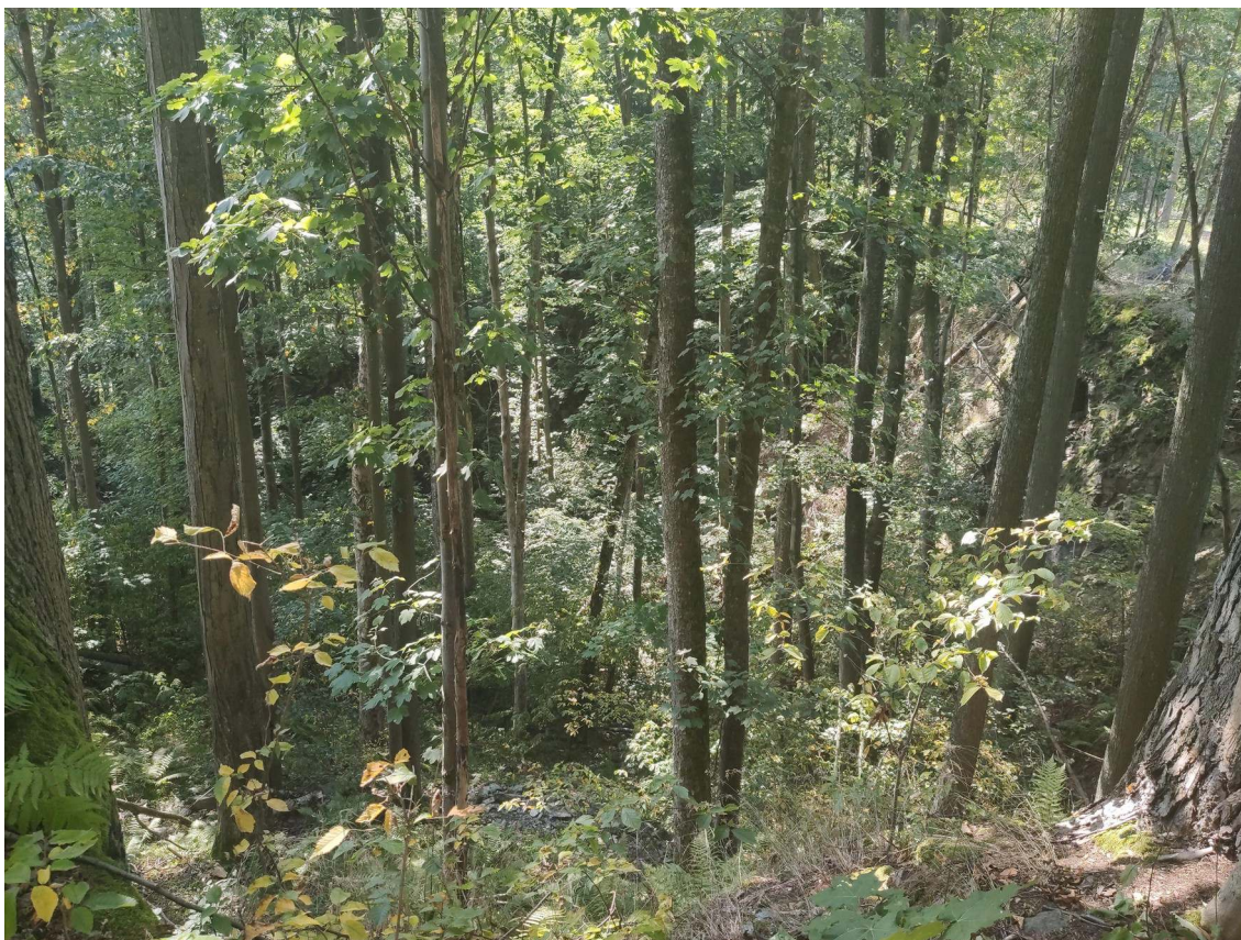
Lomová jáma ze severu – 30. 8. 2024