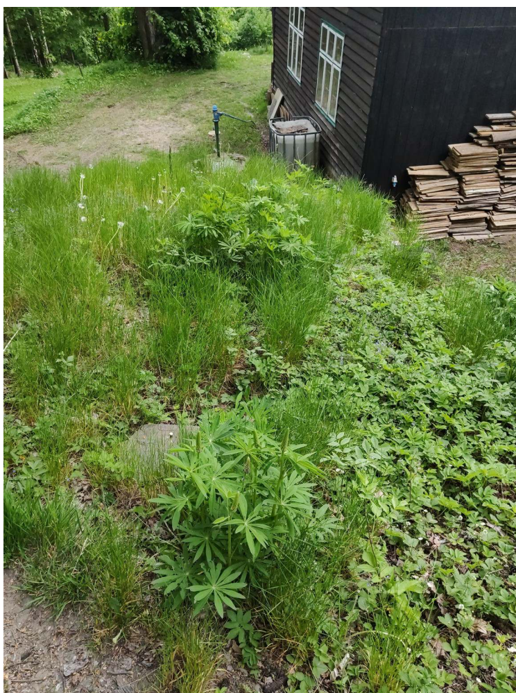
Lupina mnoholisttá ( Lupinus polyphyllus) v ochranném pásmu - 14. 5. 2025