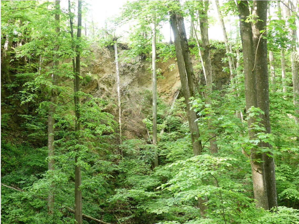
Svahový sesuv v severozápadní části lomové jámy – 14. 5. 2025