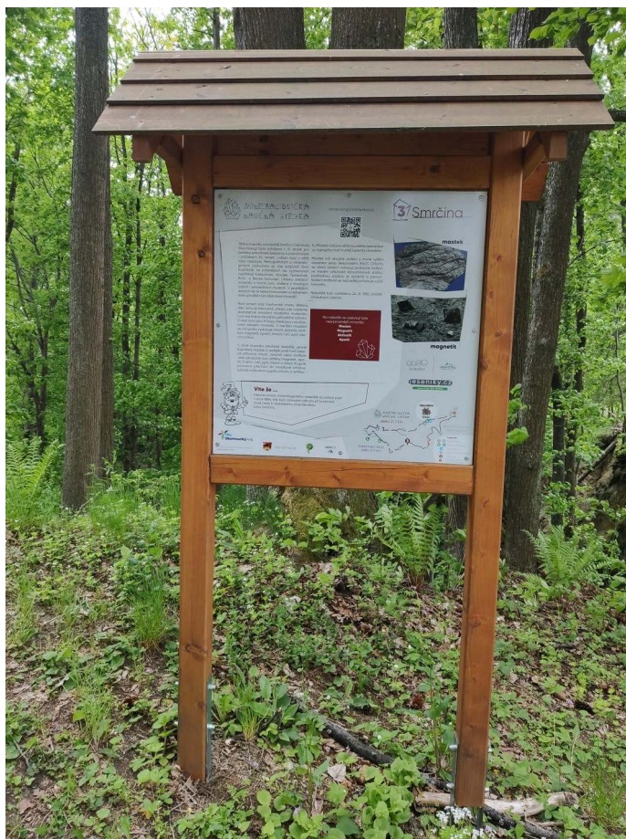
Cedule mineralogické naučné stezky - 7. 5. 2025