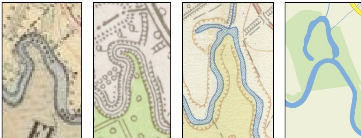
Obr. A) Postupný vývoj meandru Moravy zachycen na mapě III. vojenského mapování Moravy z let 1876–1878, reambulované III. vojenské mapování z roku 1945, topografické mapě reambulované roku 1972 a stávající základní mapě.

Odstavené říční rameno vděčí za svůj vznik regulačním úpravám, které probíhaly v tomto úseku Moravy na konci 60. a začátku 70. let 20. století. Dle prvního plánu péče o ZCHÚ (1994–2000) došlo k odstavení meandru v roce 1973. To potvrzuje i topografická mapa reambulovaná roku 1972, na které ještě není provedena regulace Moravy a patrné je pouze menší slepé rameno, k jehož odstavení od toku zřejmě došlo přirozenou cestou (viz obr. níže).