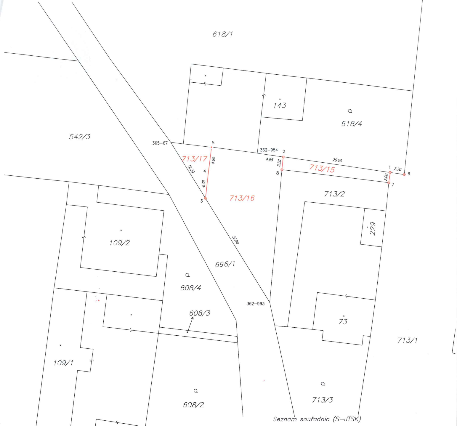
Seznam souřadnic (S-JTSK)