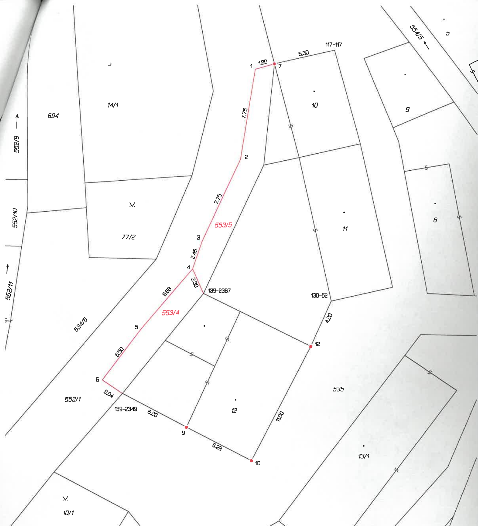
Seznam souřadnic (S-JTSK) Číslo bodu Souřadnice pro zápis do KN